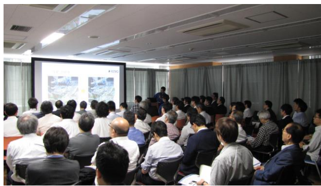
昨年の展示・セミナー会場