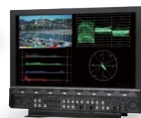
【4K入力対応ウェブフォームモニター】