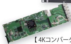
【4Kコンバーターボード】

8Kと同じく、4K放送も来年の開始を控え、急ピッチで準備が進められています。4K番組制作の現場で求められる、HDRとSDRの両立というテーマに対して、ダイナミックレンジ、色域、解像度を切り口に、さまざまな製品を出展いたします。