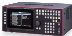
【デジタルビデオ信号発生器】

8K/4KやHDRなどの新しい技術に対して、HDMIをはじめとするデジタルインターフェースもそれらに対応すべく進化を遂げています。解像度や画像を自由に設定できるデジタルビデオ信号発生器、映像信号に付属するさまざまなパラメータを解析するHDMIアナライザーなど、アストロデザインのHDMI製品群をぜひご覧ください。