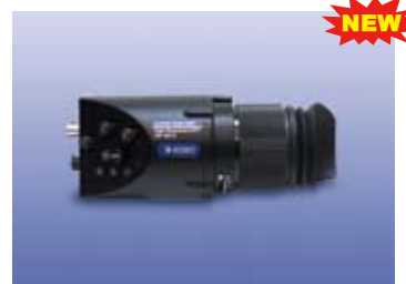
有機 EL 1080 ビューファインダー DF-3512