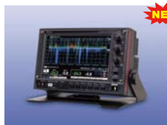
高性能ラウドネスモニター AM-3807