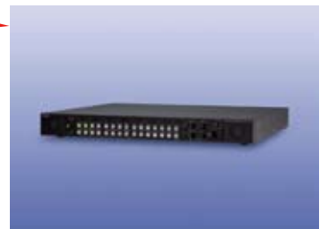
字幕監視ラスタライザ HW-7066