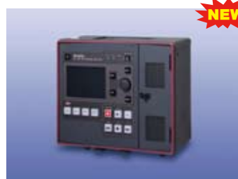
4K 非圧縮 SSD レコーダー HR-7510