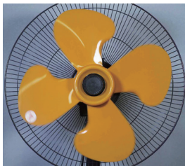
グローバルシャッター