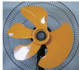
ローリングシャッター