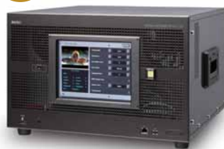
メディアインテグレータ MI-2100