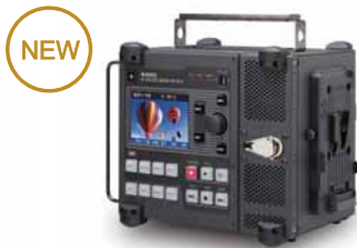
4K ポータブルレコーダ HR-7510