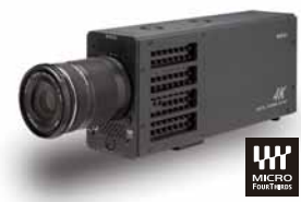
マイクロフォーサーズ対応 4K カメラ AH-4413