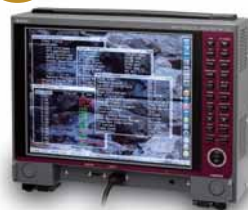
MHL対応 プロトコルアナライザ VA-1836