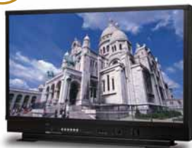
32インチ 4K モニタ DM-3432