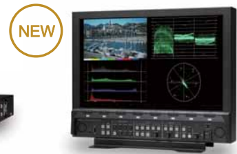
4K ウェブフォームモニタ WM-3206