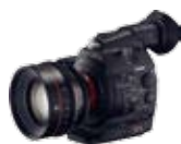
CINEMA EOS C500